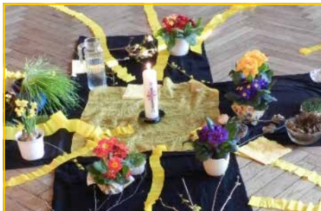
Legearbeit aus einer früheren Familien-Auferstehungsfeier

Karsamstag, 4. April: 17.00 Uhr: Auferstehungsfeier in der Bonifatiuskirche Gemeinsam mit den Kindern werden wir die Ostererzählung hören und den Weg von der Trauer des Karfreitags zur Freude des Osterfestes erfahrbar machen.