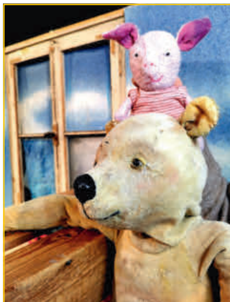
PREMIERE unseres neuen Kinderstücks „Pu, der Bär“ für Kinder ab 4 Jahren.