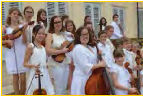
Jugendbarockorchester die Telemänner Stuttgart