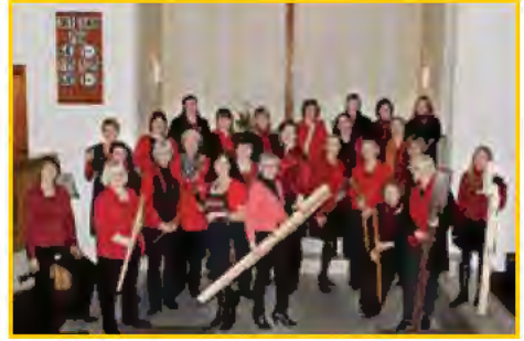
Blockflötenensemble Pikobella Dürrenbüchig