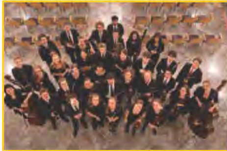
Junge Philharmonie Karlsruhe

deutsche Gesänge, weshalb das Werk auch als „Konzert nach alten Volksliedern“ bezeichnet wurde. Das Gastspiel der Jungen Philharmonie Karlsruhe (kurz JuPhKa) findet statt am Sonntag, 22. November um 19 Uhr, der Eintritt beträgt 12 Euro, für Schüler und Studenten 5 Euro. Die Karten sind erhältlich an der Abendkasse, namentliche Reservierungen möglich unter info@juphka.de .