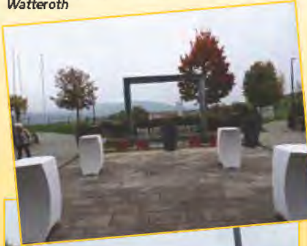
Fotos vom Herbstaufzug 2015 des Bürgervereins der Weststadt e.V.